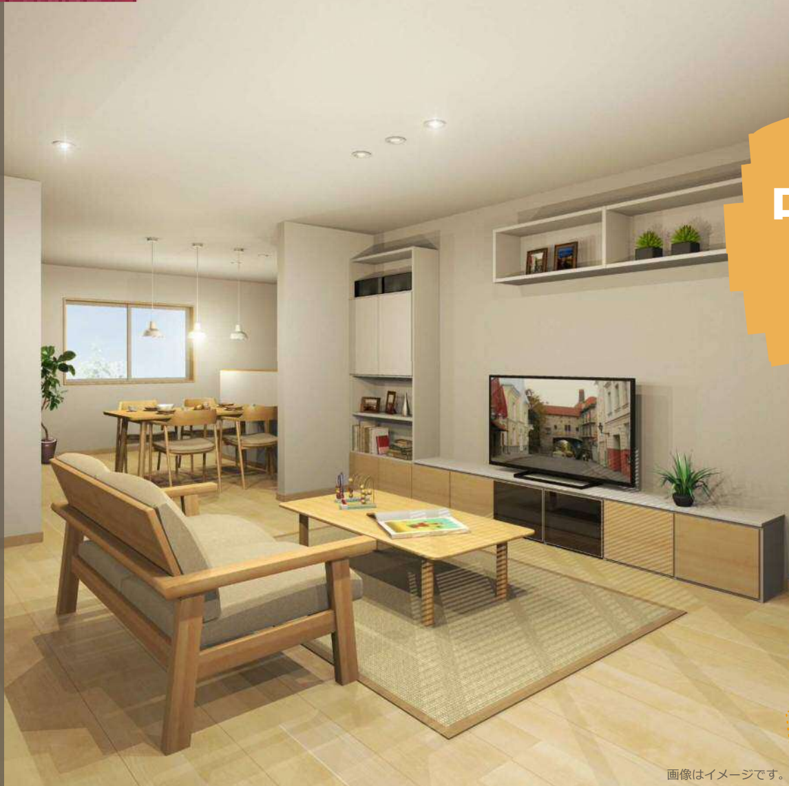
画像はイメージです。

リフォームを体感しよう。 実際の建物を見て、触れて リフォームの良さを体感してください!!