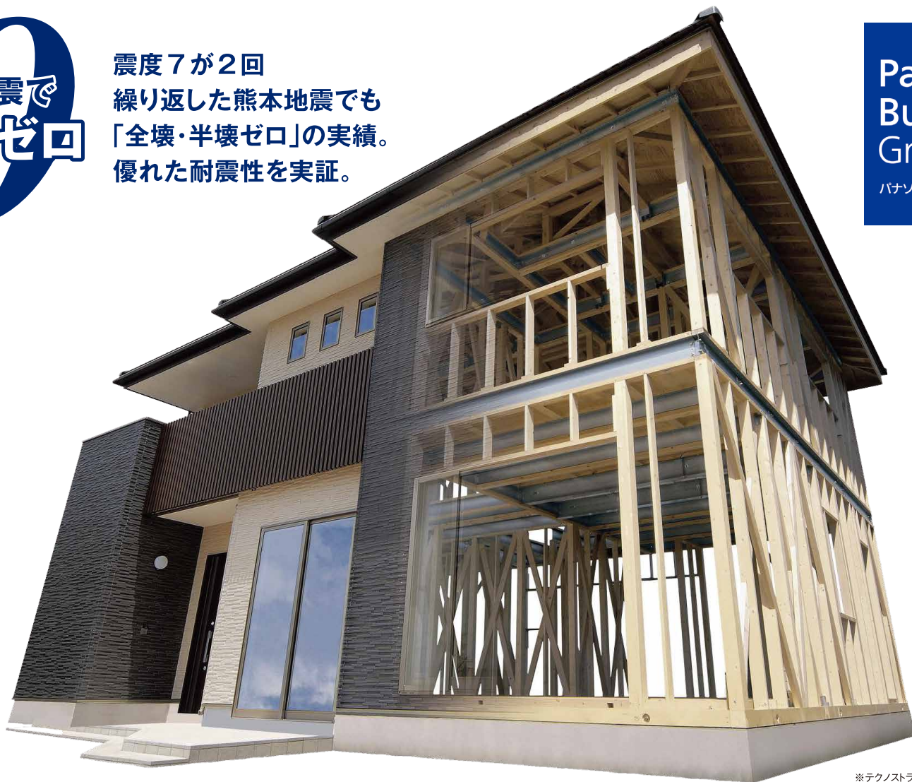
※テクノストラクチャー構造イメージ。 ※今回の建物とは異なります。